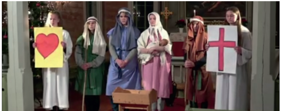
Nokre av konfirmantane var med og illustrerte juleevangeliet i gudstenesta som vart direktesendt på julaftan.

På grunn av dei nye koronarestriksjonane, måtte