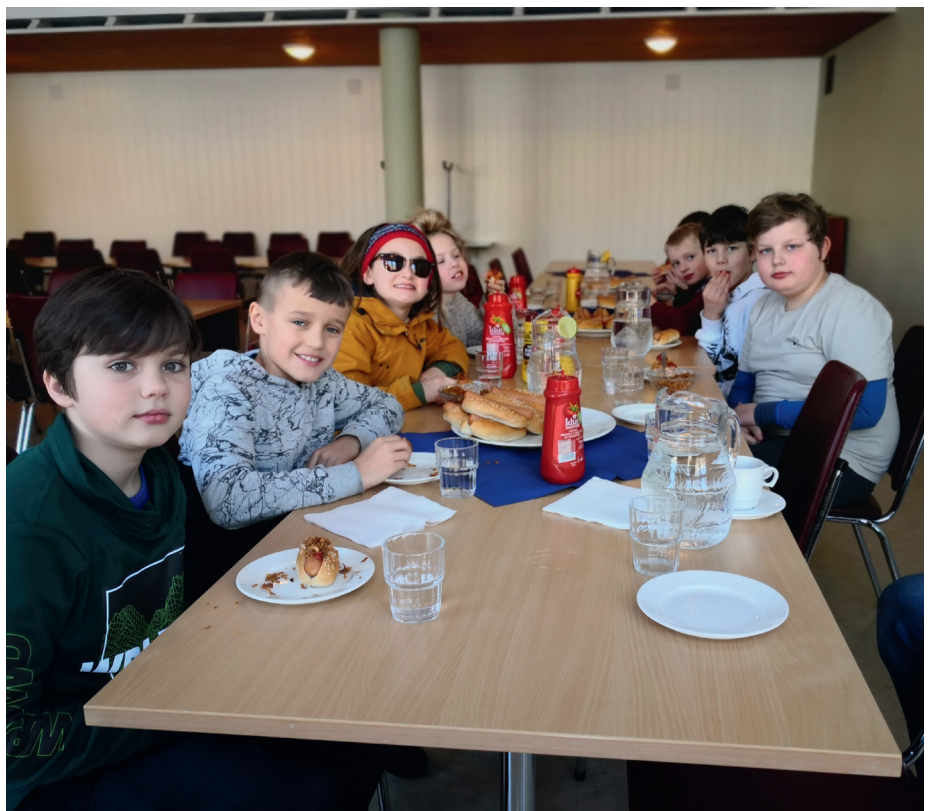
Ei gruppe med minikonfirmantar kosar seg med pølser og brød på Ljosheim.

dessverre 2-årssamlinga som var planlagt 23. januar avlyst. Med berre lov til å ha 10 på gudsteneste, måtte kyrkja gjere om på gudstenesta 31. januar der minikonfirmantane skulle delta. I staden for gudsteneste, arrangerte kyrkja samling for dei i Dale kyrkje. Kvar klasse, to på Dingemoen og ein i Flekke, fekk sine egne samlingar. På desse samlingane fekk dei med heim teikneseriebibelen.